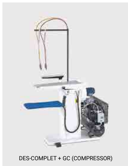
DES-COMPLET + GC (COMPRESSOR)