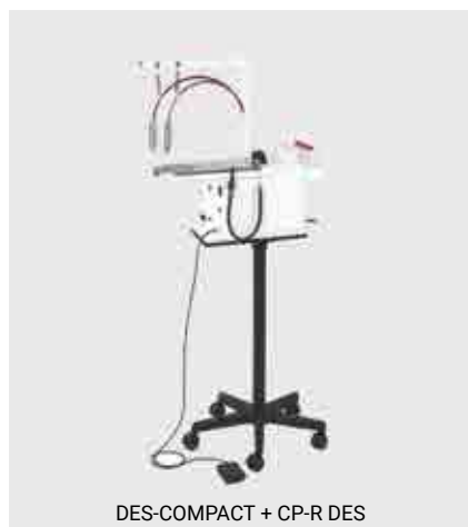
DES-COMPACT + CP-R DES